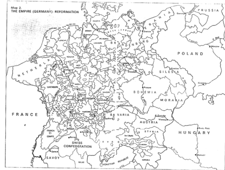
نخشه‌ی ژماره (۲)

وهرگیراوه له : H.G.Koenigshbeger and Goerge L. Mosser, Op. Cit., PP. 114-115